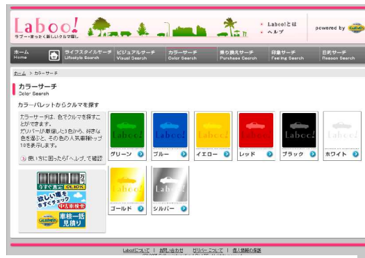
(カラーサーチ：好きな色からクルマを探せる)

「カラーサーチ」を使うと、好きな色を通して好きなクルマに出会うことができます。ガリバーが厳選した8色それぞれの色ごとの人気車種をランキング表示。カラーパレットから好きな色を選択すると、その色が合うクルマを見つけることができます。