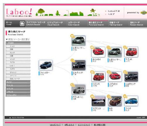
(乗り換えサーチ：人気の乗り換えパターンからクルマを探せる)

「乗り換えサーチ」では、全国にあるガリバーの店舗における買い取り、販売実績をもとに自分の好きなクルマのユーザーが次はどんなクルマに乗り換えたのかを視覚的に表示します。選択したクルマからの乗り換え人気車種が、上位3位まで表示されるため、自分と同じ好きなクルマを持っていた人、クルマの好みの近い人が、次にどんなクルマを選択したのかを通じて、好みに合うクルマを見つけることができます。