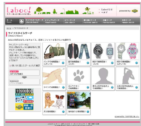
(ライフスタイルサーチ:詳しく知っているジャンルのブランドからクルマを探せる)

「ライフスタイルサーチ」では、洋服や有名人などの全10ジャンル・100アイテムのブランドそれぞれに対して、相性の良いクルマをランキング表示します。これにより詳しく知っているジャンルの好きなブランドを選択するだけで、ユーザーそれぞれのライフスタイルにぴったりのクルマを探ることができます。ランキングは、3万人を対象としたアンケート調査の結果に基づいた、チームラボが提供しているマーケティングサービス「ブランドデータバンク」を利用し、作成されています。